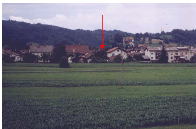
Slika 1.3.2. Opazovalkina hiša in meteorološka postaja slikani z vzhoda, 29. 6. 2001