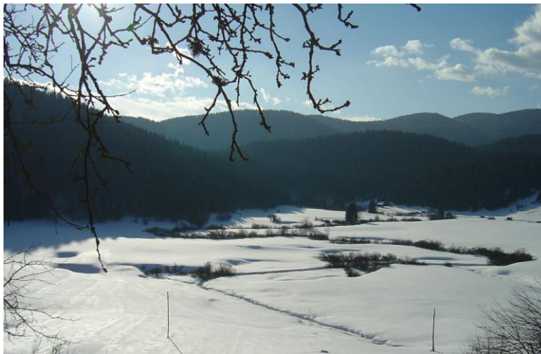
Slika 0.1.1. Dolina Loškega Potoka - primer zadrževanja padavin v obliki snega (januar 2005)

Gladine podzemne vode so v januarju v vseh aluvialnih vodonosnikih po Sloveniji upadale. Poleg izrazitega primanjkljaja mesečnih padavin je na zniževanje gladin vplivalo tudi zadrževanje vode na površini v obliki snega in led v tleh. Dvig podzemne vode je bil ta mesec zabeležen le na redkih postajah na območju Ljubljanske kotline, saj je zaradi večjih globin nekaterih vodonosnikov na tem območju dotok v podzemno vodo zakasnel. Ponekod smo tako še vedno beležili vpliv povečane količine padavin, padlih na tem območju v mesecu decembru.