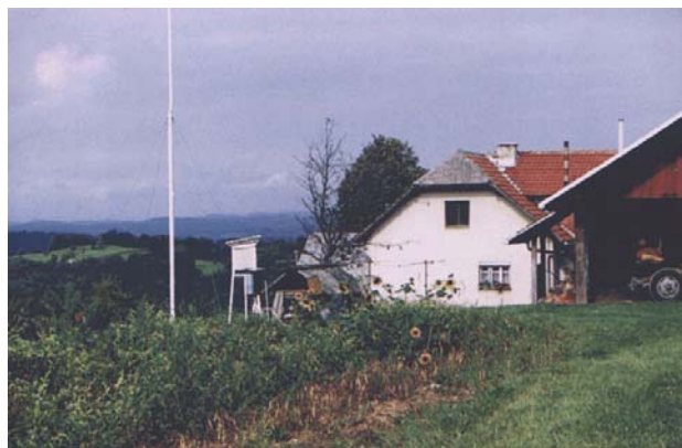
Figure 1.5.2. Meteorological station in Malkovec, a view to north, on 26 th of August 1996

Slika 1.5.3. Meteorološka postaja v Malkovcu, pogled proti zahodu, 26.8.1996