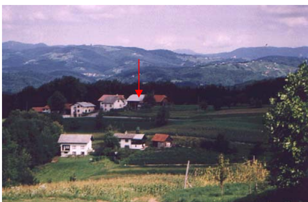
Figure 1.5.1. Geographical position of meteorological station in Malkovec

Slika 1.5.2. Meteorološka postaja v Malkovcu, pogled proti severu, 26.8.1996