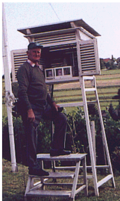
Figure 1.5.3. Meteorological station in Malkovec, a view to west, on 26 th of August 1996

Na postaji v Malkovcu merijo temperaturo zraka 2 m nad tlemi, vlago zraka, smer in hitrost vetra, višino padavin in snežne odeje ter opazujejo oblačnost in meteorološke parametre. Od julija 1999 merijo temperaturo in vlago zraka, smer in hitrost vetra ter višino padavin tudi z elektronskimi senzorji.