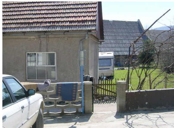
Slika 3. Ombrometer na postaji Hotedršica, slikano proti jugu, marec 2006

Temperaturo zraka so merili od februarja do decembra 1926 na Ravniku pri Hotedršici, v tem času niso merili padavin.