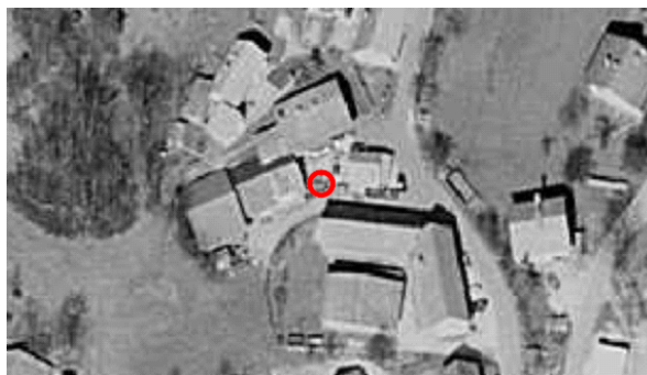
Figure 1. Geographical position of meteorological station Hotedršica

Meteorološka postaja je na severnem delu vasi Hotedršica, na nadmorski višini 550 m. Dežemer (ombrometer) je postavljen na opazovalčevem dvorišču, obdan je s hišami.